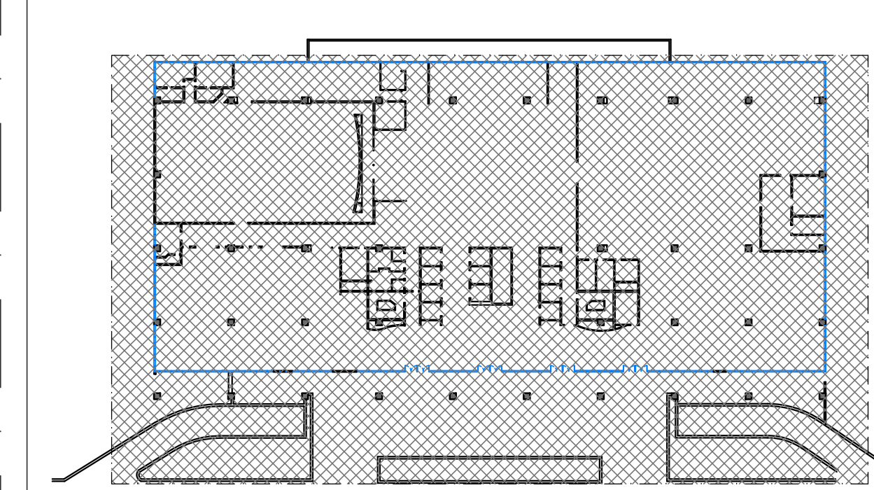
MAPA CHAVE ELEVACÃO - ESCALA 1/750