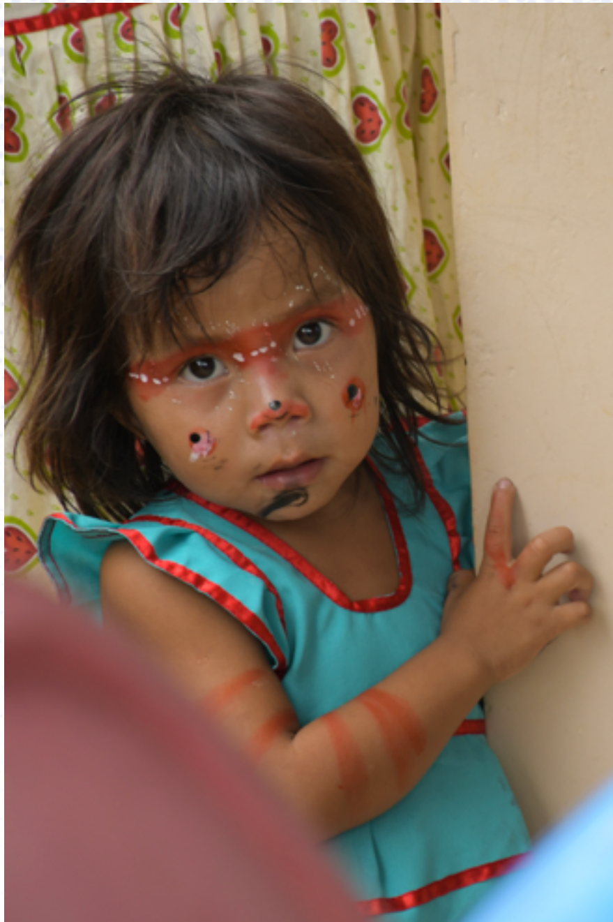
DVO MAXAKALI Foto: Cecilia Pederzoli - 2023 Cervo TJMG