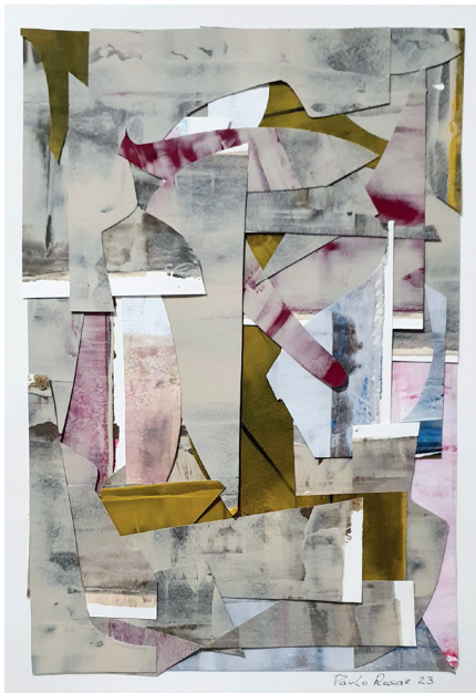
Colagem 01 Acrilica e colagem sobre papel 42 x 30cm 2023