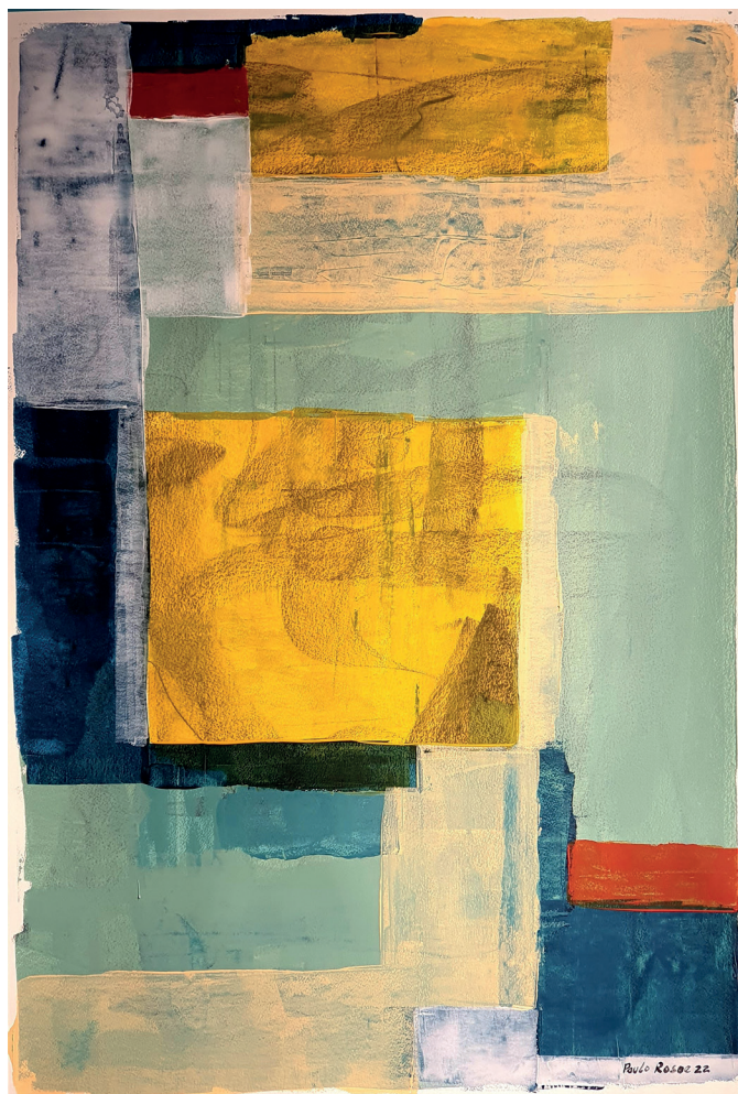
Gaman II Acrílica sobre tela 110 x 75cm 2022