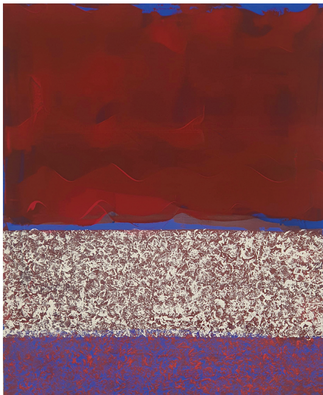
Alma mineira Acrílica e monotipia sobre tela 120 x 100cm 2023