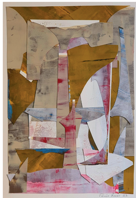
Guardado a uma chave Acrilica e colagem sobre papel 42 x 30cm 2023