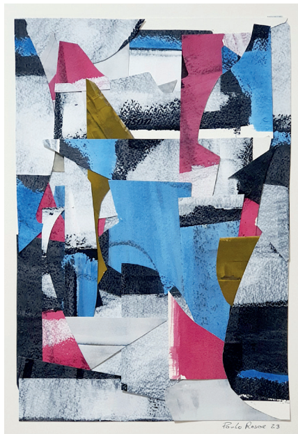
Fitar o sol Acrilica e colagem sobre papel 42 x 30cm 2023