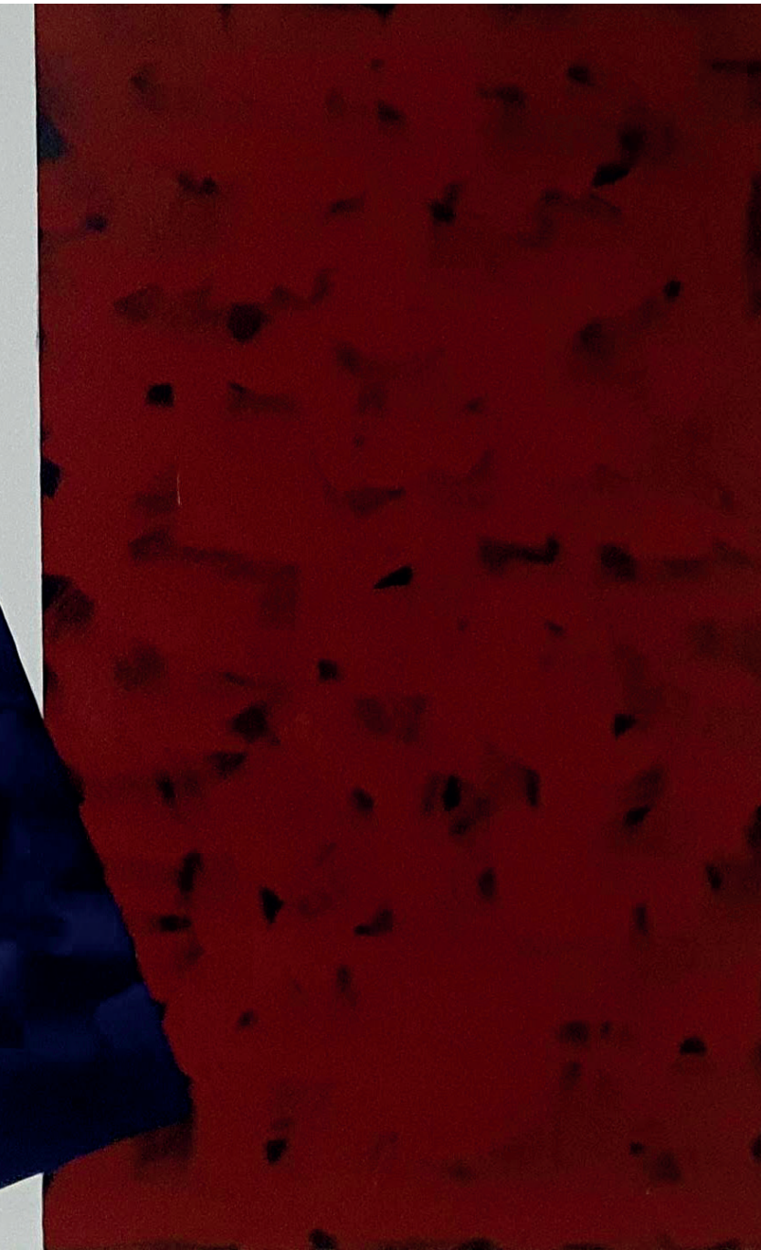
O que você vê, é o que você vai levar Acrílica sobre tela 90 x 150cm 2023