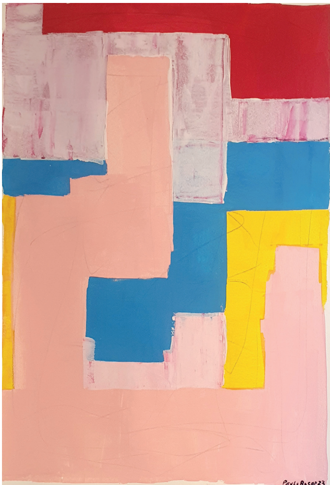
À flor da pele Acrílica e carvão sobre tela 110 x 75cm 2023