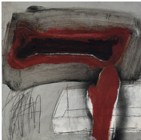
SEM TÍTULO TINTA ACRÍLICA, PIGMENTOS NATURAIS E CARVÃO SOBRE CHASSI 60x60 cm ECCE HOMO, 2020