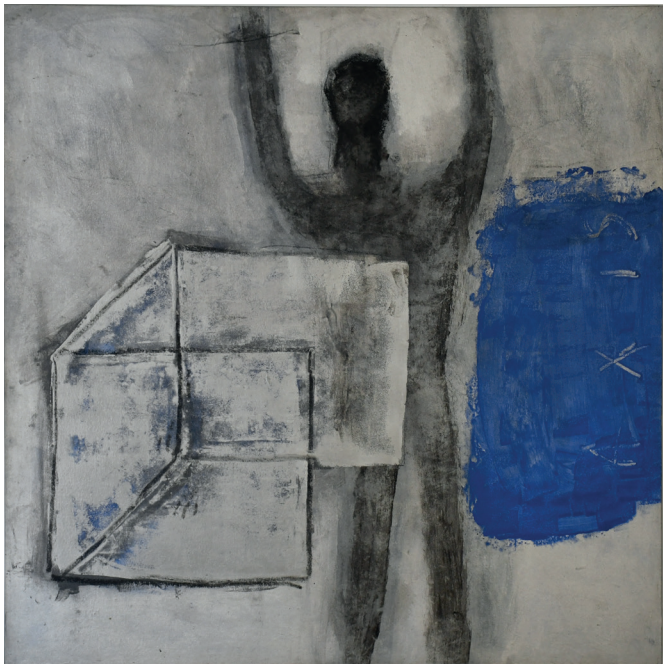
SEM TÍTULO TINTA ACRÍLICA E CARVÃO SOBRE TELA 140x140 cm ECCE HOMO, 2015