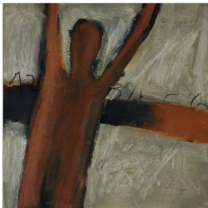
SEM TÍTULO TINTA ACRÍLICA, PIGMENTOS NATURAIS E CARVÃO SOBRE CHASSI 40x40 cm ECCE HOMO, 2020