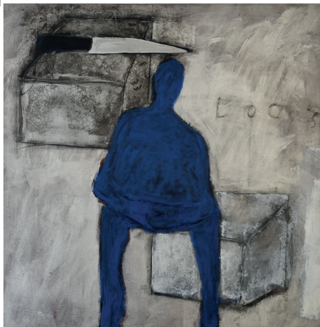
SEM TÍTULO TINTA ACRÍLICA E CARVÃO SOBRE TELA 140x140 cm ECCE HOMO, 2015