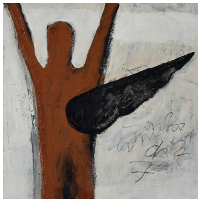
SEM TÍTULO TINTA ACRÍLICA, PIGMENTOS NATURAIS E CARVÃO SOBRE CHASSI 40x40 cm ECCE HOMO, 2020