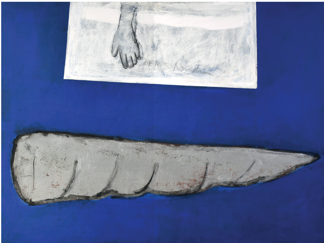
SEM TÍTULO TINTA ACRÍLICA, PIGMENTOS NATURAIS E CARVÃO SOBRE CHASSI 120x160 cm ECCE HOMO, 2025