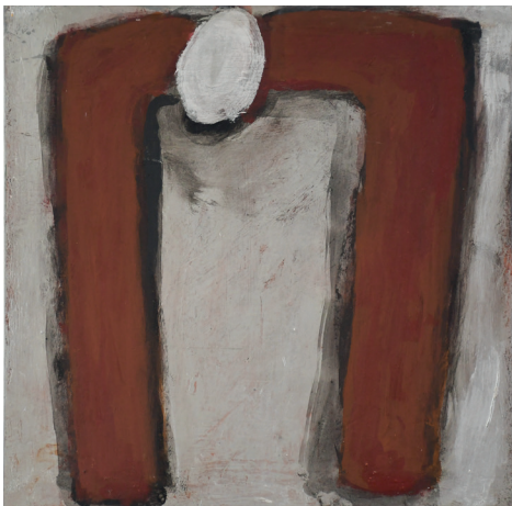
SEM TÍTULO TINTA ACRÍLICA, PIGMENTOS NATURAIS E CARVÃO SOBRE CHASSI 60x60 cm ECCE HOMO, 2020