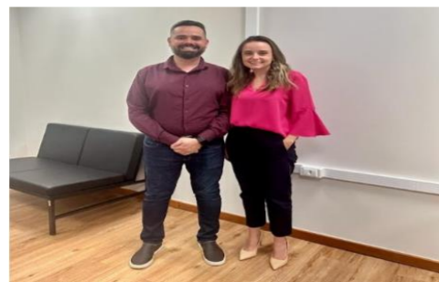
Visita técnica no CEJUSC da Comarca de Abaeté, ocorrida no dia 06/10/2022.