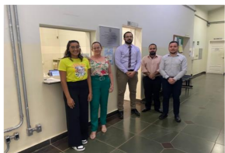
Visita técnica no CEJUSC da Comarca de Pompéu, ocorrida no dia 04/10/2022.