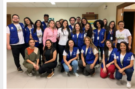
Equipes do CRP e do CEJUSC de Contagem que atuaram no mutirão, que também teve participação do laboratório Hermes Pardini

O Centro de Reconhecimento de Paternidade (CRP) do Tribunal de Justiça de Minas Gerais realizou, no dia 10/11, o primeiro mutirão no Fórum de Contagem, na Região Metropolitana de Belo Horizonte.