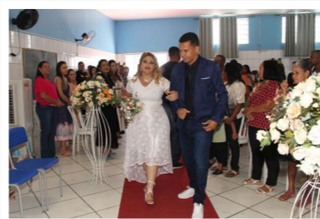
Evento foi celebrado por amigos e familiares