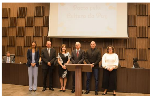
Um dos destaques do evento foi a assinatura do pacto pela Cultura da Paz

Ocorreu no dia 07/11/2022, durante a abertura da Semana Nacional da Conciliação, a assinatura do Termo de Cooperação Técnica para o Pacto Interinstitucional pela Cultura da Paz e Resolução Consensual dos Conflitos.